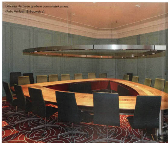
Eén van de twee grotere commissiekamers.

De veranderingen die rijksarchitect Bremer in 1930 aanbracht bij de transformatie tot provinciehuis zijn in hun volle rijkdom hersteld. Twee anti-chambres naar de Statenzaal bevatten een kleurig glas-in-lood ramen, oude banken uit de vroegere Statenzaal, goudleer-behang en een monumentale, op zolder teruggevonden lamp van