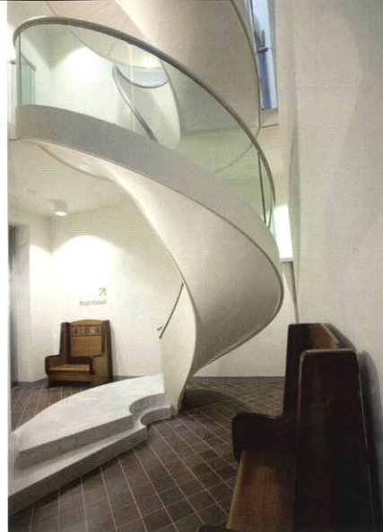
De nieuwe wenteltrap, geplaatst in de ruimte waar rond 1800 een diensttrap was.