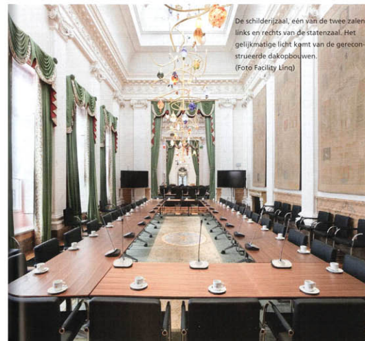
De schilderijzaal, één van de twee zalen links en rechts van de Statenzaal. Het gelijkmatige licht komt van de gereconstrueerde dakopbouwen.

De restauratie van de zalen en kamers vereiste uitgebreid archiefonderzoek. De historische kleuren van de overwegend risicoloo-beige geschilderde interieurs en de rijke collectie antiek meubilair moesten worden gereconstrueerd, evenals de stoffering en de oude behangels. Verlaan & Bouwstra Architecten zette een aantal archiefonderzoekers in gang die onder meer inrichtingslijsten uit de >>