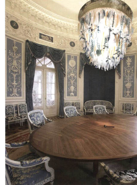
De muziekzaal, in gebruik als vergaderzaal van de Gedeputeerde Staten; de kroonluchter is van Bert van Loo.

en bezoekersstromen te scheiden. Om het hoofdtrapportaal niet te belasten ontwierpen we een nieuwe trap en lift die bezoekers rechtstreeks naar de Statenzaal op de eerste verdieping brengen, zonder de beveiligde bestuursvleugel te doorkruisen." Ze werden aangebracht in de oksel van het gebouw, dat wil zeggen in de knik van de L-vorm. De monumentale, nieuwe wenteltrap is van 18 mm dik staalplaat, gelast volgens technieken uit de scheepsbouw en heeft een balustrade van imposant gebogen glas. Hij is zwaar, maar niet opdringerig. Hij rust op een marmeren sokkel en mondt uit in een glazen koepel in het dak, waarin Bert Grotjohann een