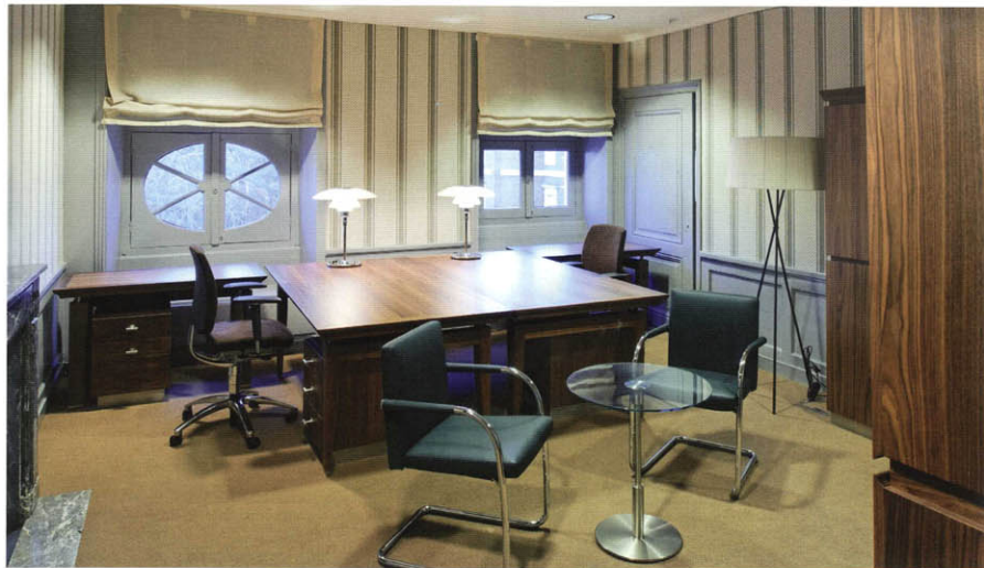
Werkvertrek op de voormalige rommelzolder, met maatwerk bureaus en papieren wandbespanning aan de hand van gevonden historisch papierbehang.