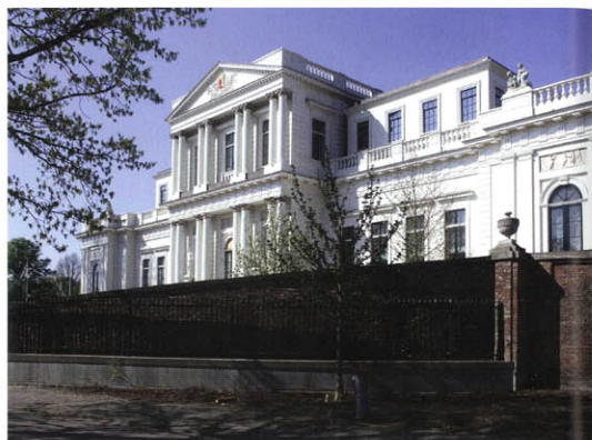
De zuidgevel, met links en rechts van het middendeel gereconstrueerde dakopbouwen.

Met het laat-achttiende-eeuwse Paviljoen Welgelegen is iets merkwaardigs aan de hand. De monumentale hoofd vleugel heeft een voor Nederland ongebruikelijke allure en lijkt een statige entree te bevatten. Hij suggereert een symmetrische plattegrond, maar niets is minder waar: de hoofdingang ligt verstopt aan de achterkant van het gebouw dat bovendien niet symmetrisch is. Het heeft een L-vormige plattegrond, waarvan de lange poot monumentale zalen bevat terwijl de korte poot rijke, maar lagere appartementen herbergt. Achter een uniforme façade rijgt Paviljoen Welgelegen een bonte verzameling kamers en zalen aan die onverwacht variëren qua maat en verhouding. Na de vele verschillende gebruikers en de nodige restauraties was er van deze oorspronkelijke variatie weinig over. Verlaan & Bouwstra Architecten uit Vianen kreeg in 2005 de opdracht het monument te verbouwen en voerde dit project, dat ook het exterieur en de tuin omvatte, uit i.s.m. SATIJNplus architecten. Bart Bekooij, ontwerper bij Verlaan & Bouwstra roemt de rijkdom van Paviljoen Welgelegen, maar trof een 'verrommeld' gebouw aan: "Overal waren kantoortjes toegevoegd. De zolder was dichtgebouwd, evenals een deel van de historische keuken en alles zat onder dikke lagen beige verf. We waren niet alleen verantwoor-