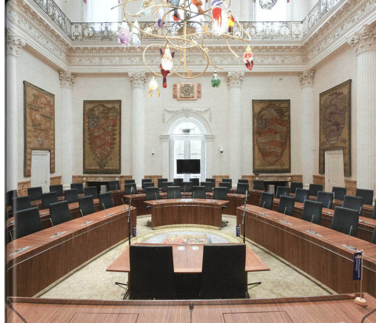
De Statenzaal, met wandkleden uit 1930 en lichter van Michel van Overbeek.