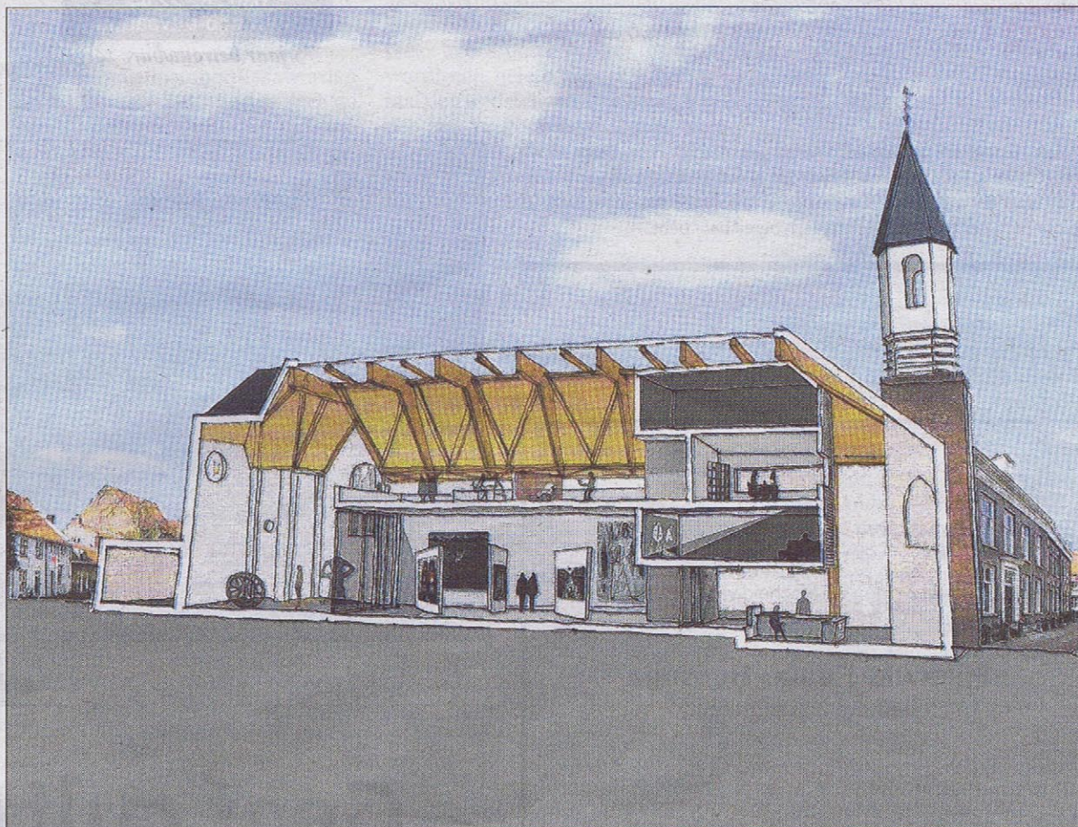
Een 'pronkstuk' wordt de hoge houten kap, die deels daglicht gaat doorlaten. BRON MARX&STEKETEE ARCHITECTEN BV

voor verbeteringen aan te brengen, zegt Ploum. „Omdat we nu alles opnieuw kunnen inrichten, kunnen we ruimtes en voorzieningen schepden die tegemoetkomen aan de vraag van de hedendaagse museumbezoeker.”